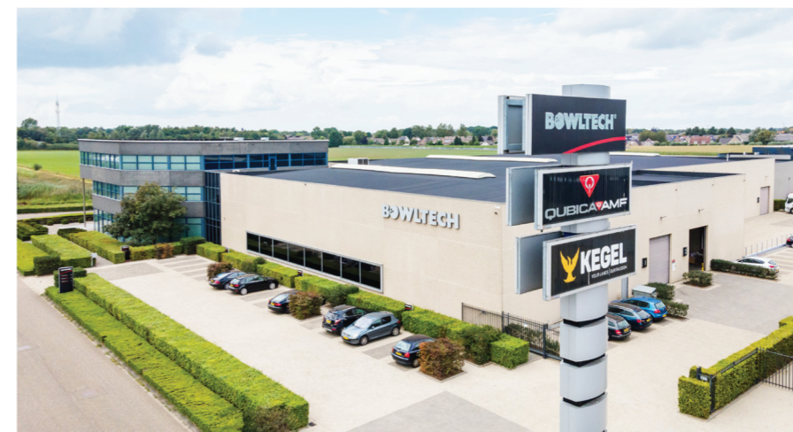
Das Bowltech-Zentrallager in Made (Niederlande) bietet mehr als 70.000 qm Lagerkapazität.

In dieser Zeit wurde Bowltech auch Vertriebspartner für Steltronic und übernahm die Distribution für Eu-