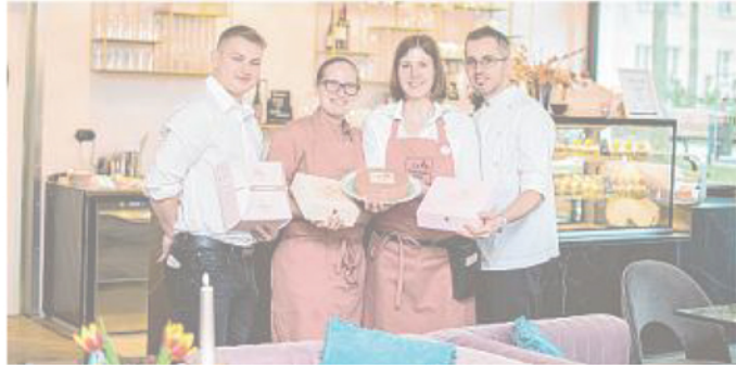
Das Team des Café Le Gâteau rose präsentiert die rosarote Torte in den Kurpark Kolonnaden.

2 Jahre und 1.000 Torten. Das Café Le Gâteau rose feiert doppeltes Jubiläum mit Rabatt und einem Glas Sekt.